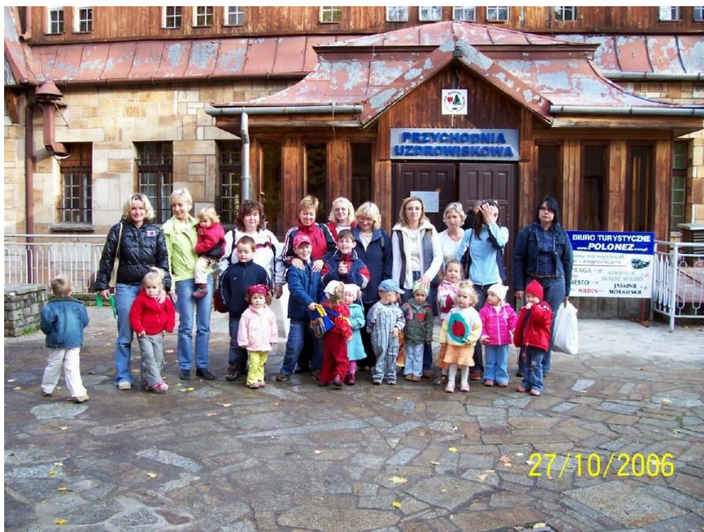
Návštěva solné jeskyně v Polsku