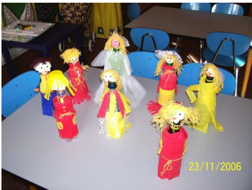
Výroba panenek z PET lahví, „Ekologický den aneb i my u víme, kam lahvičky neházíme“