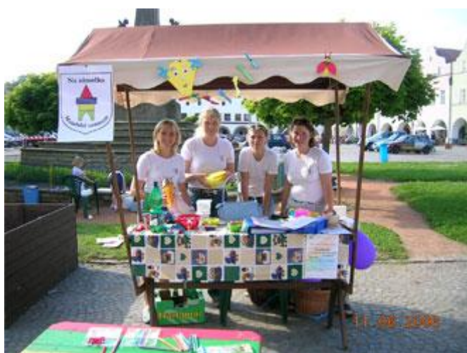
Spolkový den, červen 2006