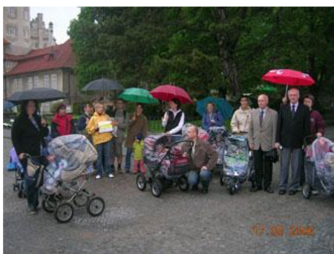
Jak se žije s kočárky, květen 2006