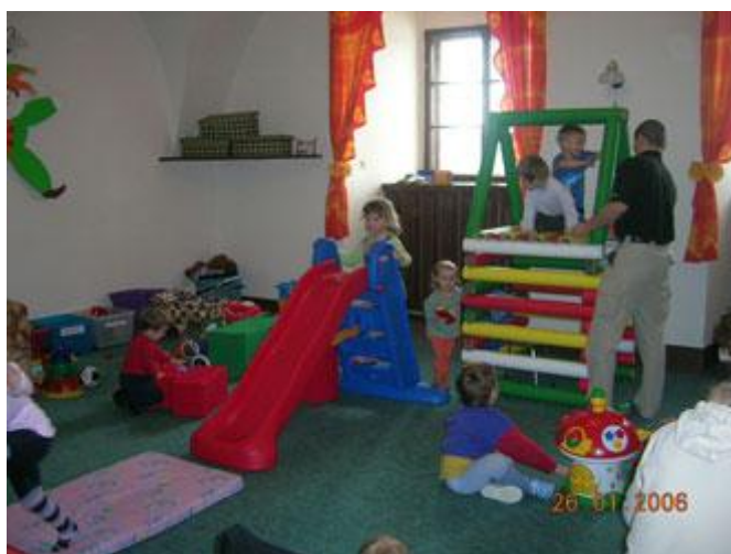
Z herny MC